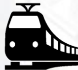
Железнодорожные пути необщего пользования