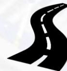
Дорожная инфраструктура (автомобильные дороги)