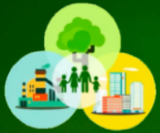
СХЕМА ИЛИ МЕХАНИЗМ СОФИНАНСИРОВАНИЯ